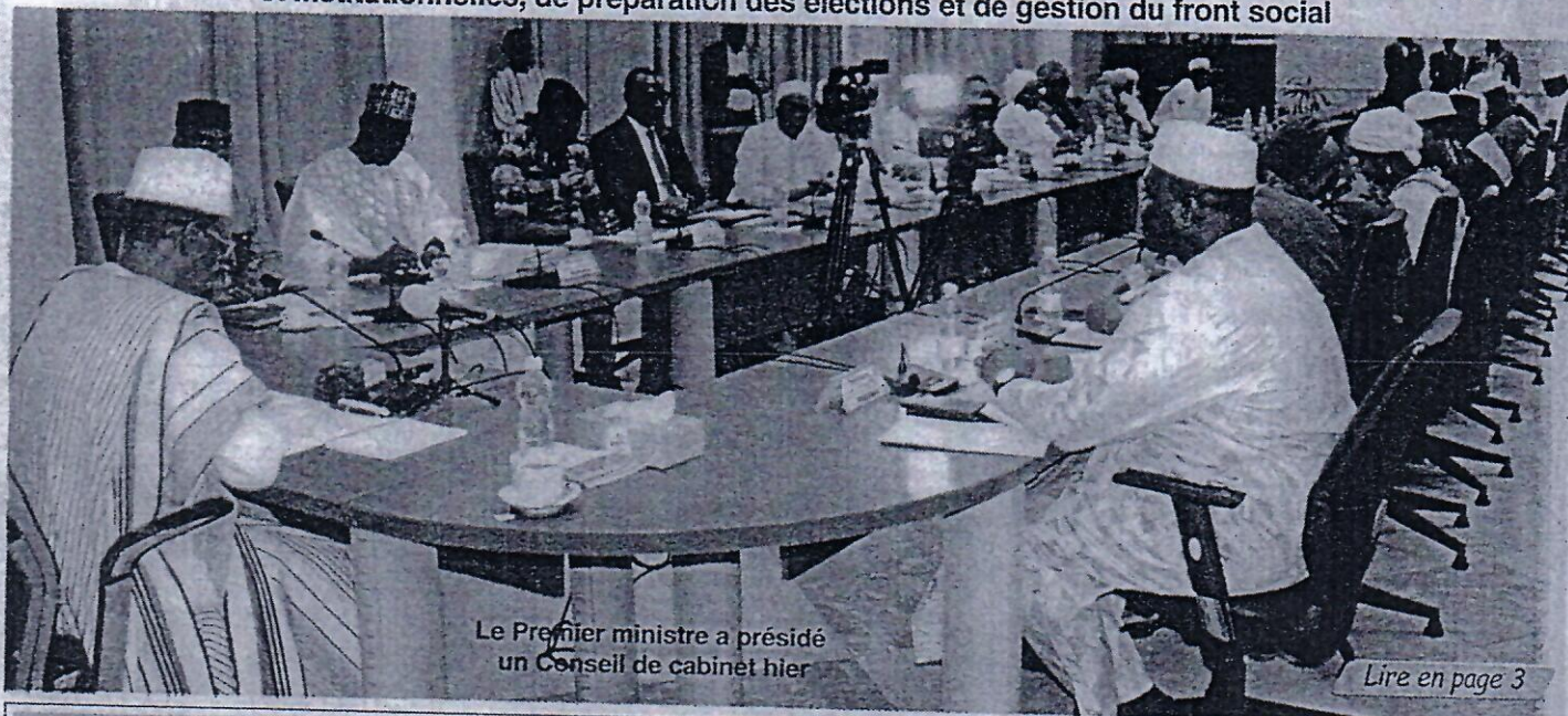
Le Premier ministre a présidé un Conseil de cabinet hier

La nouvelle équipe dirigée par le Premier ministre Choguel Kokalla Maïga entend consolider les acquis et maximiser les gains obtenus en matière de défense, de sécurité, de diplomatie, de réformes politiques et institutionnelles, de préparation des élections et de gestion du front social