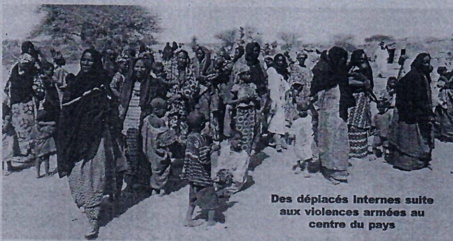
Des déplacés Internes suite aux violences armées au centre du pays

Des milliers de déplacés internes affluent vers Ségou et San P3